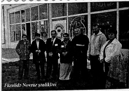
Füzulidə Novruz şənlikləri

lər, xüsusilə, tapmacalar, yanıltmaclar mövcuddur, yaranıb, yaşayır, yenə də yaranmaqdadır.