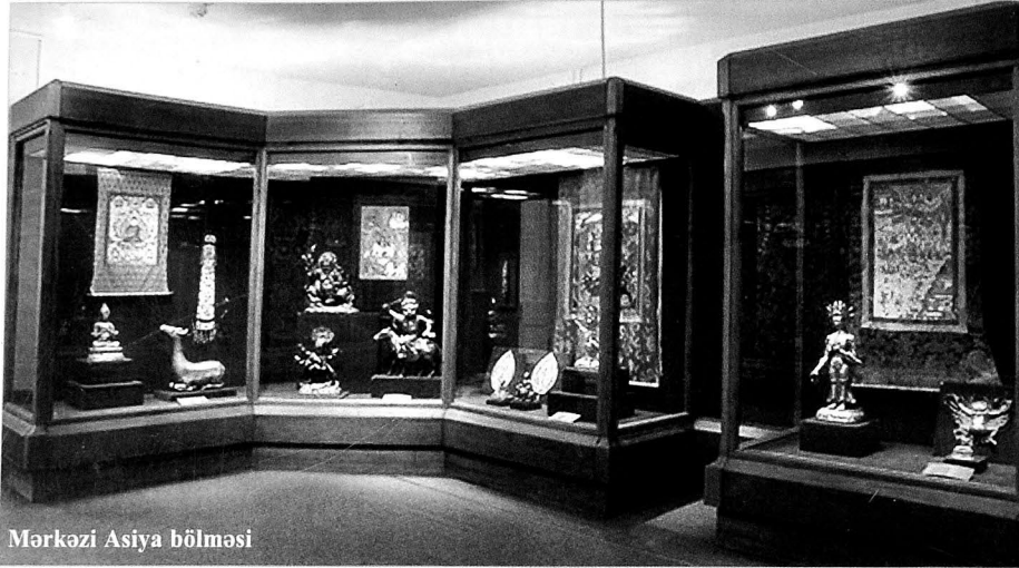
Mərkəzi Asiya bölməsi