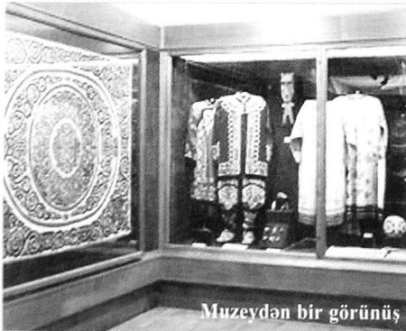
Muzeydən bir görünüş

Muzeydə qorunan XV əsrə aid feodal Yaponiyasının məişətinə daxil olan çay mərasimlərinin üçün qablar maraqlıdır. Qeyd etmək lazımdır ki, Yaponiyada təşkil edilən çay mərasimləri, ayrı-ayrı adamları bir-birinə yaxınlaşdırır, dostluğu, mehribanlığı artırır, münasibəti daha da yaxşılaşdırmaq vasitəsinə çevrilir.