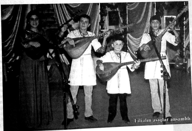
Filialın aşıqlar ansamblı

Bələcə, müəssisələrdə olduq, onların son illər gördüyü işləri yoxladıq və bəri başdan deyim ki, fəaliyyətindən narazı qaldığımız kollektivə rast gəlmədik. Məlum oldu ki, şöbənin özündə birləşdirdiyi incəsənət məktəbi, kitabxana və mədəniyyət evinin qazandığı uğurların başlıca səbəbi təkcə burada çalışan əməkdaşların işlərinə məsuliyyət