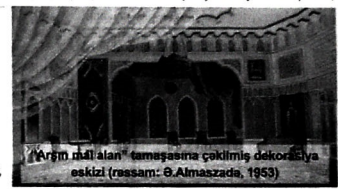
"Arşın Amlalan" tamaşasına çəkilmiş dekorasiya eskizi (rəssam: Ə.Əlmaszadə, 1953)

Muzeyin eksponatlarına zənginləşməsi istiqamətində inə nəünsə də diqqət çəkdi. "Təəs-süf ki, bizim bəzi sənət adamlarının düşüncəsində Teatr Muze-yi yalnız onların evlərində yığılıb qalan proqram və afişaların, bir qisim fotoların saxlanc yendir. Arxivlərinə təqdim edərkən insantların marağ doğuracağı əşyaları üstünlük vermirlər. Bir növ alları gəlir. Bizə arxiv idarəsi kimi yanaşılır. Unut-maq olmağ ki, onların əşyaların muzey üçün dəyərli eksponat,