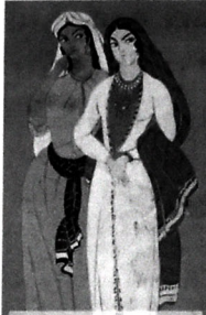
"Leyli və Məcnun" operasında Leylinin rəfiqələrinin geyim eskizi (rəssam: B.Əfqanlı, 1958)