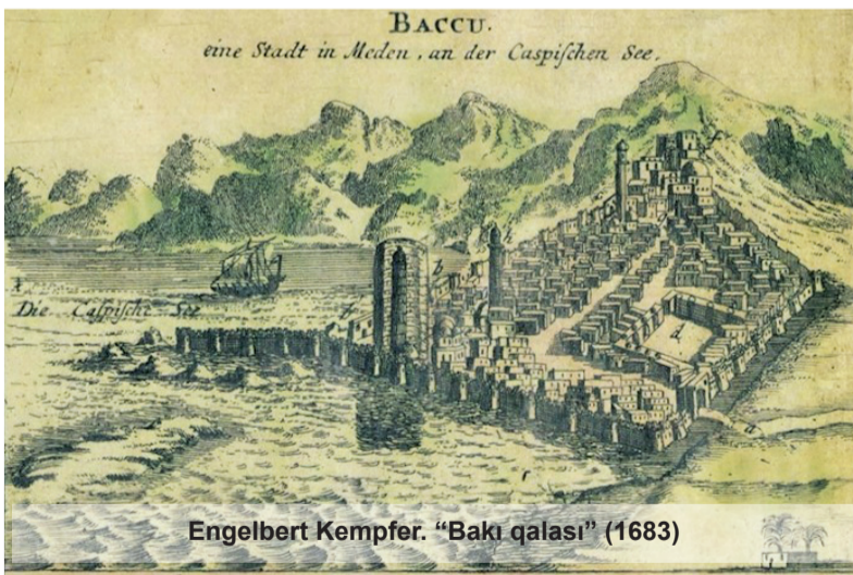
Engelbert Kempfer. "Bakı qalası" (1683)

1828-ci ildə İran-Rusiya müharibələrinin yekunu olaraq Türkmənçay sülh müqaviləsi imzalandı. Azərbaycan ikiye bölündü. Bundan sonra Şimali Azərbaycana rus hərbi-topoqraflar, rəssamlar və araşdırmaçıların axını artdı. Çoxlu sayda təsviri sənət əsərləri də yarandı. Bu dövrdə Avropadan Rusiya imperiyasına səyahət edən bir çox müəlliflərin də yolu Qafqazdan, Azərbaycandan keçirdi. Onlardan biri məşhur fransız yazıçısı Aleksandr Düma idi.