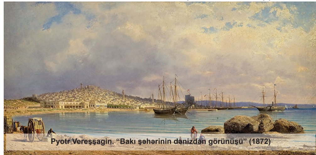
Pyotr Vereşşagin. "Bakı şəhərinin dənizdən görünüşü" (1872)