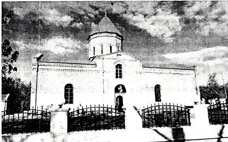
Албанская церковь Святой Девы Марии, расположенная в поселке Нидж Габалинского района

Квартал ремесленников находился в месте, которое местное население называет Йаныг йер (Горелая земля). Это условное название дано местности после того, как здесь были найдены во время раскопок остатки двух больших произ-