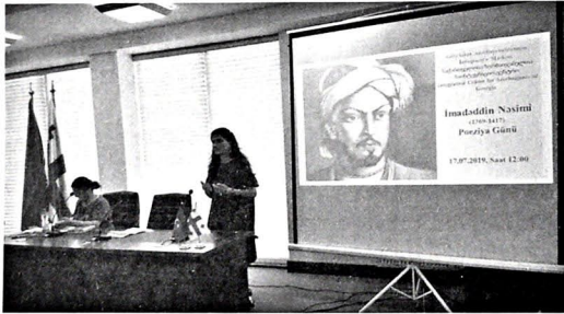
Marneulidə İmadəddin Nəsimiyə həsr olunmuş Poeziya Günü