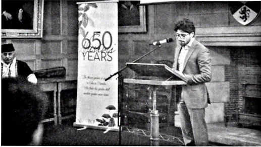
St.Andrews Universitetində Nəsiminin 650 illiyi ilə əlaqədar keçirilmiş poeziya gecəsi

Prezident İlham Əliyevin 2019-cu ilin ölkəmizdə “Nəsimi İli” elan olunması ilə bağlı Sərəncamına əsasən, dahi Azərbaycan şairinin 650 illik yubileyi bütün dünyada geniş qeyd olunur. Bununla əlaqədar Şotlandiyanın St.Andrews Universitetində yaradılan Azərbaycan Cəmiyyətinin təşkilatçılığı, Beynəlxalq Türk Mədəniyyəti və İrsi Fondu, Diasporla İş üzrə Dövlət Komitəsi və Azərbaycanın Böyük Britaniya və Şimali İrlandiya Birləşmiş Krallığındakı səfirliyinin birgə dəstəyi ilə böyük şair və mütəfəkkirin doğum gününə həsr olunmuş poeziya gecəsi keçirilib.