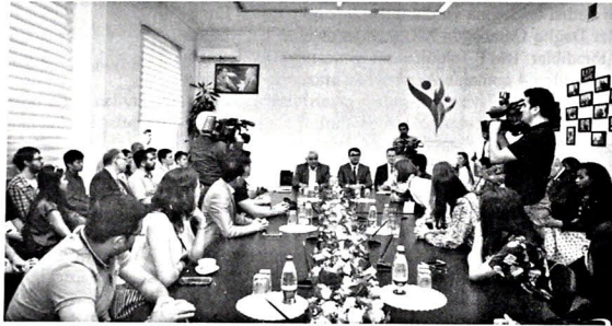
Multikulturalizm Yay Məktəbi iştirakçılarının BBMM-də akademik Kamal Abdulla ilə görüşü.

Himayəçilik Şurasının sədri qonaqların nəzərinə çatdırıb ki, Azərbaycanda multikultural həyat tərzinin qədim tarixi və böyük ənənələri var. Ən qədim zamanlardan ölkəmizdə müxtəlif xalqların nümayəndələri arasında dərin dostluq və qarşılıqlı əməkdaşlıq mühiti formalaşmışdır. "Azərbaycan multikulturalizminin ədəbi-bədii qaynaqları" kitabı ölkəmizdəki multikultural həyat tərzinə işıq salır.