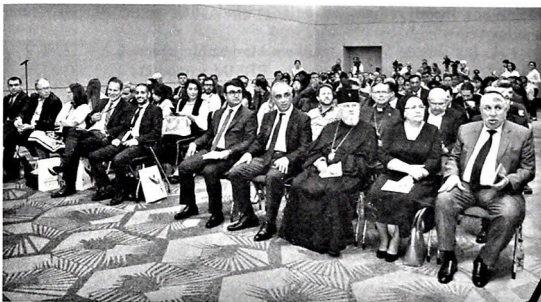
IX Beynəlxalq Multikulturalizm Yay Məktəbinin açılış mərasimindən görüntü

İyulun 15-də Bakı Beynəlxalq Multikulturalizm Mərkəzi (BBMM) "Bakı Mədəniyyətlərarası Gənclər Forumu: Dinlərarası dialoqdan fəaliyyətə doğru" adlı IX Beynəlxalq Multikulturalizm Yay Məktəbi layihəsinə start verib.