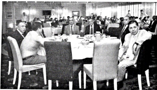
IX Beynəlxalq Multikulturalizm Yay Məktəbinin yekun tədbiri