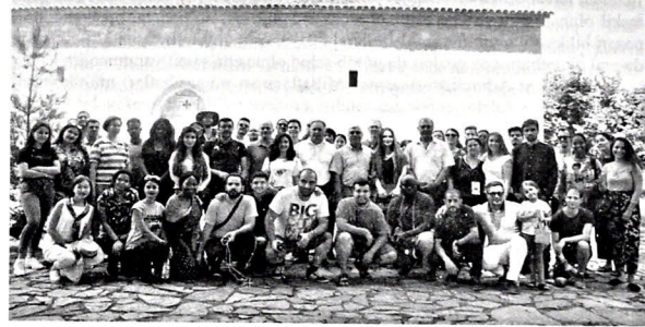
Multikulturalizm Yay Məktəbinin iştirakçıları Qəbələ rayonunun Nic qəsəbəsində

IX Beynəlxalq Multikulturalizm Yay Məktəbinin iştirakçıları Qəbələ rayonuna səfər ediblər. Tələbələr udilərin yaşadığı Nic qəsəbəsində yerləşən "Cotari" Alban-Udi Kilsəsini və "Azərbaycan-Udi Ocağı"nı ziyarət edib, Qəbələdəki "Tufandağ" Qış-Yay Turizm İstirahət Kompleksində olublar.