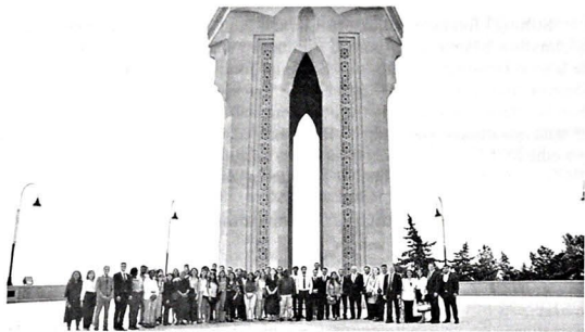
Multikulturalizm Yay Məktəbinin iştirakçıları Şahidlər xiyabanında

Azərbaycan paytaxtının mənzərəsini seyr edən iştirakçılara Şahidlər xiyabanının tarixi və Bakıda görülən abadiyyət-quruculuq işləri barədə məlumat verilib.