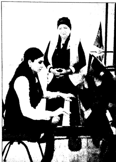
(Начало на стр.4)

И я вдруг понимаю, что такое словообразование: есть ответственность - ответственно работает, совесть - совестно - меня вполне устраивает в нашей беседе. Ясно, о чем речь. А ректор продолжает: