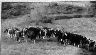
На колхозном пруду

- Я шофером проработал четверть века, ездил по всему Азербайджану - и везде нас уважают, - рассказывал заведующий цехом по переработке подсолнечника (тем самым, что создали бы еще при царском ре-