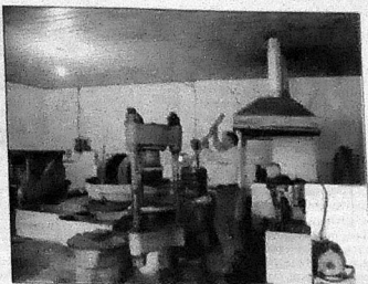
Цех по переработке подсолнечника

Первое впечатление не обмануло. Выяснилось, что на ток нет трейлеров и решет для очистки от сорных семян и калибровки зерна, не говоря уже об умных агрегатах, которые сразу разделяют его на несколько фракций и подсушивают, что запчастей для устарев-