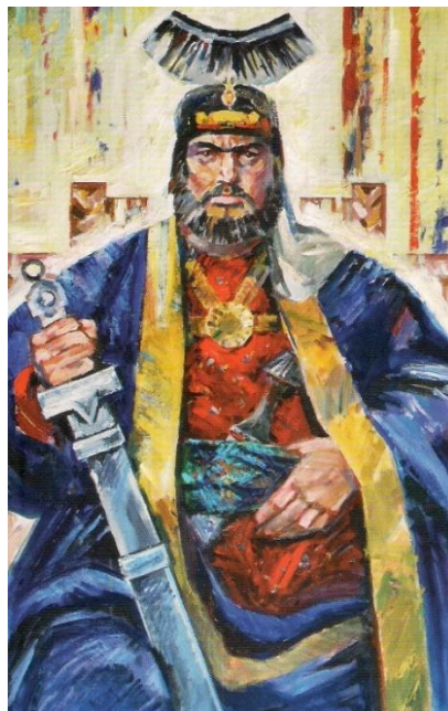
İLL 1. Altay Hacıyev “Eldəniz Atabəy” (kətan, yağlı boya, 100x68 sm)

Azərbaycan təsviri sənətində ilk ikonoqrafik obraz kimi xarakterizə edilən “Atabəy Eldəniz”(ill 1) əsərində rəssam güclü ifadəli, məğrur gücü ilə diqqəti cəlb edən türk hökmdarına diqqətləri cəlb edir. Eldənizin baş geyiminin üzərində aypara işarəsi onun hamiyyəti dövründə Azərbaycanın şimal və cənub torpaqlarının birləşməsi və Yaxın şərqin qüdrətli qüdrətli dövlətinə çevrilməsidir. Atabəy Eldənizin sevimli xanımı “Möminə Xatun”a həsr edilən portretdə geyimi üzərindəki parlaq buta naxışları ritmik təkrarlanır.