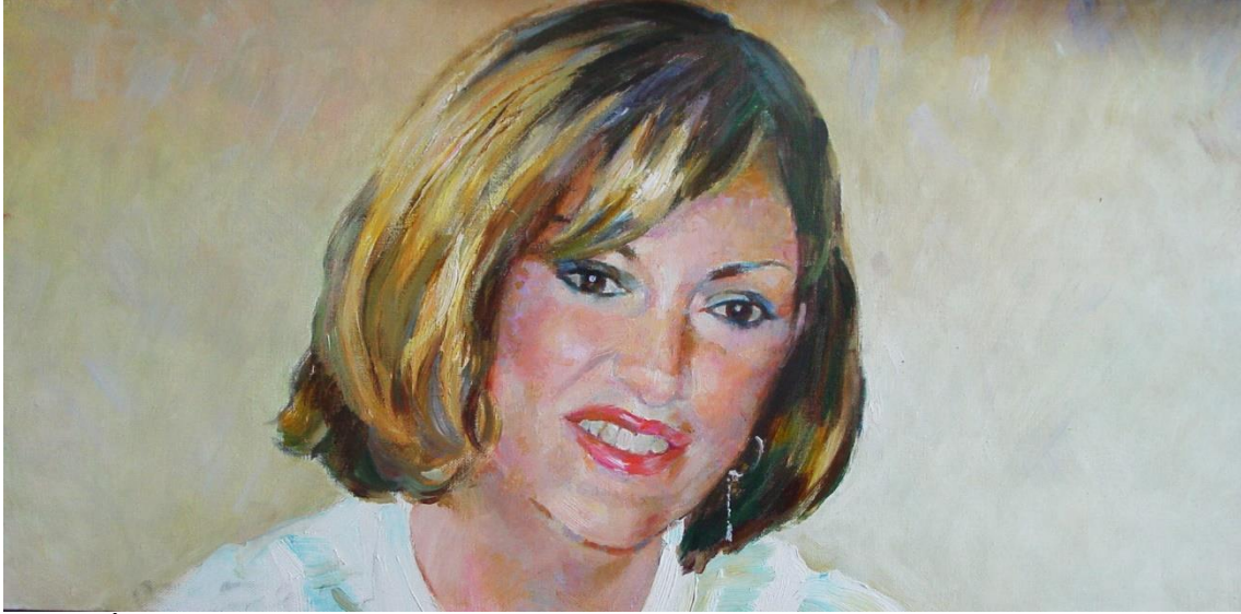
İLL 6. Altay Hacıyev “Mehriban Əliyeva” (kətan, yağlı boya)

Azərbaycanın birinci xanımı, lider qadın məktəbi fenomeni anlayışının banisi Mehriban Əliyeva obrazı müasir dövr təsviri sənətimizin diqqət mərkəzində olan ikonoqrafik tipoloji bədii prinsiplərindən biridir. Xalq rəssamı Altay Hacıyevin incə, liderlik, səmimi baxışları ilə seçilən portreti fərqli xüsusiyyətləri ilə seçilir. Işıq, blik, rəng vasitəsilə ümumi bir ideya-xalqını sevən parlaq qadın fenomeni səciyyələndirilir.(ill 6)