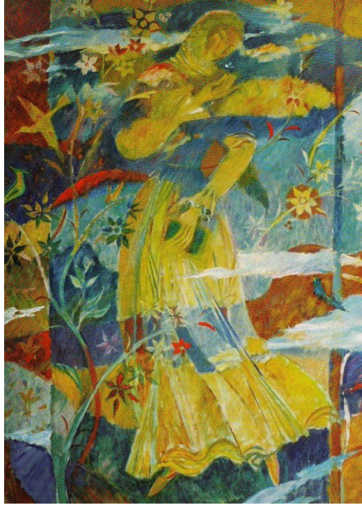
İLL 2. Altay Hacıyev “Natəvana ithaf” (kətan, yağlı boya, 100x80 sm)

Qarabağ mövzusunda yaradıcılığında geniş yer ayıran sənətkar “Xurşudbanu Natəvan” obrazına tam fərqli şəkildə leytmotiv olaraq hər bir təsvir edilən səhnədə canlandırmışdır. Bu obraza sanki yeni bir nəfəs gətirir. “Şairə” əsərində rənglərin axıcılığı, naxışların parlaq şəkildə ifadəliliyi şairənin şeirlərinin misrasını xalça kimi bəzəyir. “Natəvana ithaf” (ill 2) əsərində Qarabağın təbiəti önündə xan qızının obrazı bu torpağın Azərbaycan xalqına məxsus olmasını bir daha təsdiq edir.