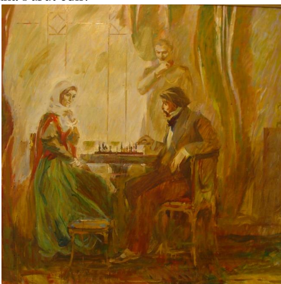
İLL 4. “Natəvan və Aleksandr Düma”

Qarabağın beşiyi sayılan Şuşada Natəvan və Qasım bəy Zakirin öz yazdığı şeirlərini təqdim etməsi sanki təbiətində bu poeziyadan ləzzət almasını rəssam öz fırçası ilə tamaşaçılara çatdırır. Natəvanın lirikası, Zakirin sərt yaradıcılığı Qarabağın şairlər, sənətkarlar yurdu olduğunu bir daha sübut edir.