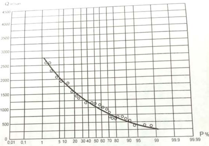
Şəkil 2. Kür çayının Salyan məntəqəsində maksimal su sərfinin təminat əyrisi [1]

Kür çayının Salyan məntəqəsində 50 illik maksimal su sərfələrinin təminat əyrisi tərtib olunub, Şəkil 2.-də verilmişdir. Burada Kür çayının Salyan məntəqəsində 1% təminatlı daşqın axını üçün 2780 m 3 /san tapılır. Bu qayda ilə çayın 2% təminatlı su sərfi 2500 m 3 /san, 3% təminatlı su sərfi 2300 m 3 /san və 4% təminatlı su sərfi 2180 m 3 /san təşkil edir.