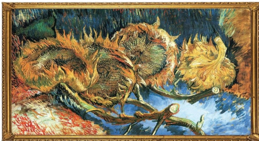
İLL 6. Vinsent Van Qoq “Kəsilməmiş dörd günəbaxan”

Dərslərdə həmçinin özünəməxsus parlaq yaradıcılıq üslubu ilə seçilən Vinsent Van Qoqun rəngkarlıqda öz fərdi tərzini haqqında da geniş məlumatlar verilmişdir. Van Qoqun yaradıcılığı Avropa mədəniyyəti tarixində mürəkkəb keçid dövrünü əks etdirir. Onun yaradıcılığı həyata, sadə, zəhmətkeş insana alovlu, çılğın məhəbbətlə doludur. Van Qoqun əsərlərindəki özünəməxsus yaradıcılıq ehtirası, onun ani ifadə qüvvəti və faciəvi coşğunluğu şagirdlərdə maraqlı oyadır (VIII sinif təsviri incəsənət metodik vəsait, 2015: 96).