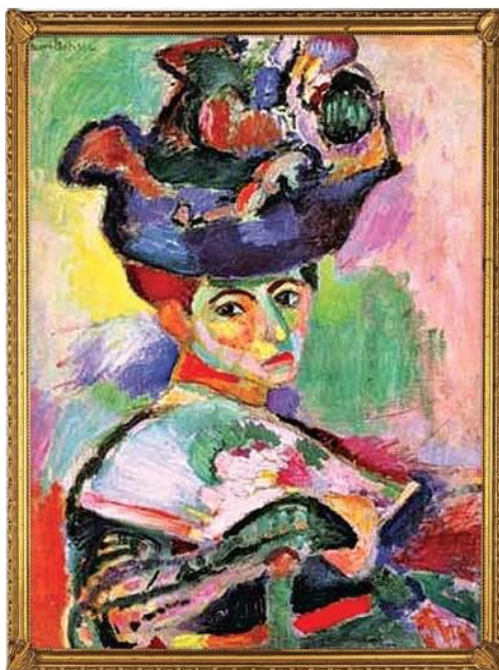
İLL 7. Anri Matis “Şlyapalı qadın”

“Anri Matis: rəngkarlıqda dekorativlik, forma və rəng” mövzusunda ilk növbədə şagirdlərə Parisin rəsm salonlarının birində tanınmış rəssamların əsərləri ilə yanaşı, Anri Matisin də “Yaşıl şlyapalı qadın” əsərinin nümayiş etdirilməsi diqqətə çatdırılır. Portretdən tamaşaçıya yanakı əyləmiş hündür şlyapalı qadın baxır. Onun asimmetrik üz cizgiləri “vəhşi” boyalarla çəkilmişdir. Təsvir real insana o qədər oxşamırdı ki, onun eybəcər görünməməsi mümkünsüz idi. Bu əsər qalmaqallı gurultu qopardı və fovizmin təməlini qoydu. VIII sinif şagirdləri fovizm cərəyanının tarixi və nəzəri əsasları haqqında mühüm məlumat öyrənirlər (9).