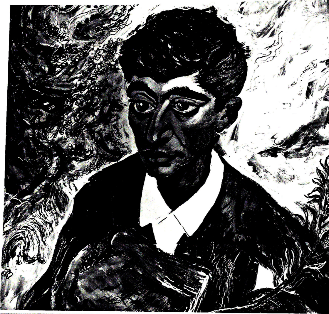
Portretin müəllifi Xalq rəssamı Toğrul Nərimanbəyovdur.

ayırdı: “Ay Fikrət, niyə bikişsən? Sən axı şeirlərinde də hamıya məsləhət verirsən ki, nə qədər fikirli, qəmli olsan da, hər kəslə gülər üzle danışmalısən. Niyə son vaxtlar belə qaşqabaqlısən? Mən buna alışmamışam...”