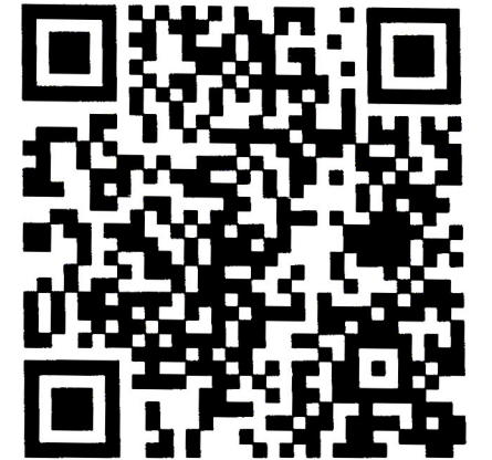
"Qarabağ nağılı" animasiya filmi