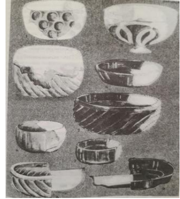
Süfrə qabları – IV-VIII əsr

1986-cı ildə Bərdə şəhərində IX əsrə aid piyalə tapılmışdır. İlk orta əsrlərdə piyalələr şərab və digər mayelərin qəbulu üçün istifadə edilirdi. Piyalələr, əsasən, 2 formada olurdu: saya və naxışlı. Saya piyalələr daha çox qədimi sayılırdı. Piyalələr yumru formalı altlıqlı və ya dabanlıdır. Üzəri paralel naxışlarla, basma, oyma, naxışlarla