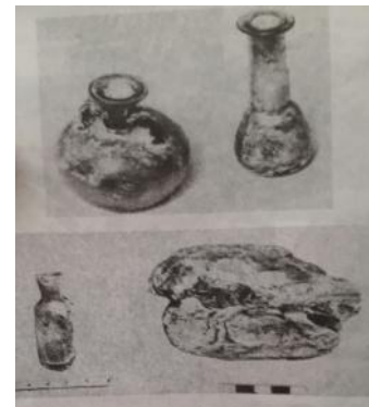
Laboratoriya qabları – III-IV əsr