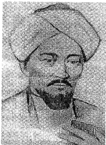
ƏBUNƏSR FARABI (873-950)