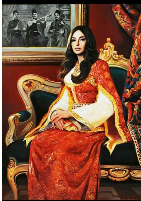
İLL 4. Asif Azərelli “Mehriban Əliyeva” (2013)(katan, yağlı boya)

Asif Azərelli yaradıcılığında isə bu mövzunun təqdim edilməsi, rəssamın fərdi yaradıcılıq xüsusiyyətlərini özündə birləşdirir. Tarixi-ədəbi obrazları isə müasir təsviri incəsənətimizin inkişafı üçün əhəmiyyətli mövqə tutur. Fərdi manerasına görə üstünlük təşkil edən Azərbaycanın birinci xanımı Mehriban Əliyevaya həsr edilən portret 2013-cü ildə Qəbələdə keçirilən beynəlxalq rəsm sərgisində qran-priyə layiq görülmüşdür. (İll 4)