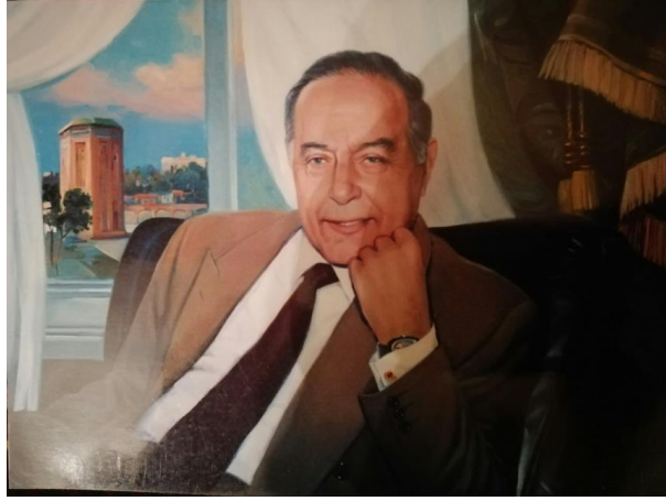
İLL 2. Asif Azarelli "Heydər Əliyev Naxçıvanda" (2010) (kətan, yağlı boya)

yasına bir neçə dəfə müraciət etmişdir. "Heydər Əliyev Naxçıvanda" (2010) əsərində dahi şəxsiyyətin fəaliyyətinin əsas mərkəzi olan doğma torpağının tarixiliyinin çatdırılmasıdır. Rəssam kompozisiyada xalqın xoşbəxt gələcəyi uğrunda çalışan lider obrazını təsvir etmişdir. Müdrək şəxsiyyət öz iş otağında əyləşərək, tamaşaçıya baxan gülürüz, ifadəli baxışları ilə seçilir. Arxa fonda açılan pəncərədə isə məşhur memar Əcəminin "Möminə Xatun" türbəsinin təsviri kompozisiyada "quruculuq" anlayışına bitkin xarakter gətirir. (İll 2)