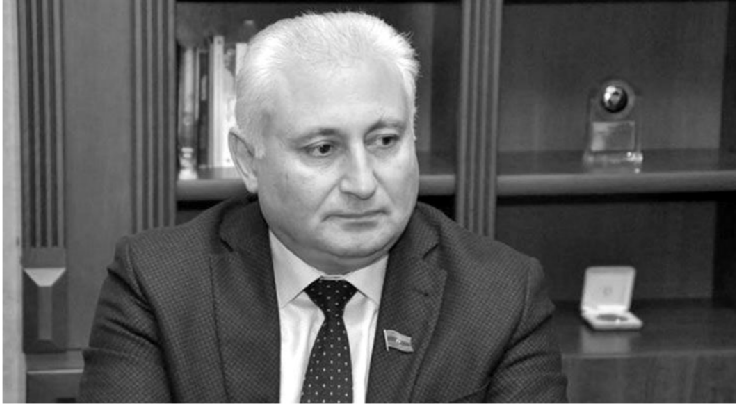
Hikmət Babaoğlu siyasi elmlər doktoru, professor