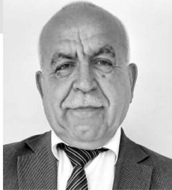
(əvvəli ötən sayımızda)