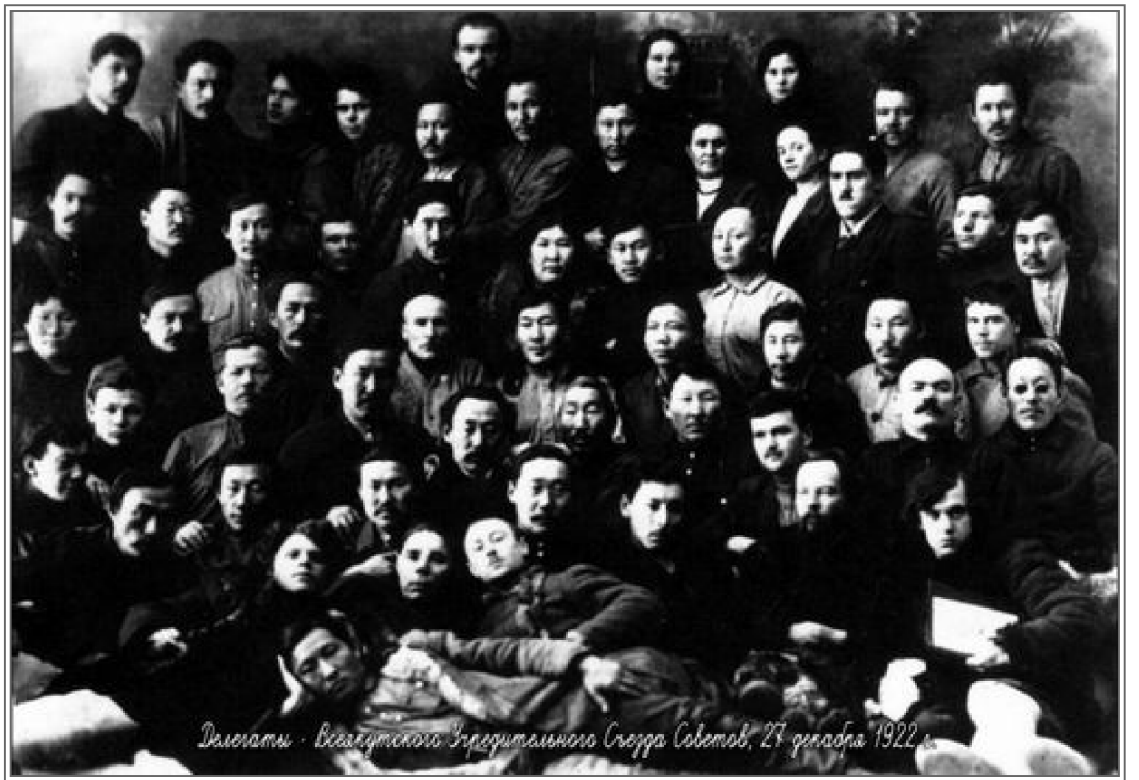
Dərsə gətirən - Vexaluytskoye İncəsənət Mərkəzi, 27 yanvar, 1922

Platon Oyunski əsərlərində yazdığı kimi etibarlı xalqı onu unutmadı. Bu gün Saxada Platon Oyunskinin adını daşıyan küçə və meydanlar, mədəniyyət və təhsil idarələri var. 1993-cü ildə isə Saxa (Yakutiya) Dövlət başçısının Sərəncamı ilə Ədəbiyyat, incəsənət, memarlıq sahəsində uğur qazananlara Platon Oyunskinin adına