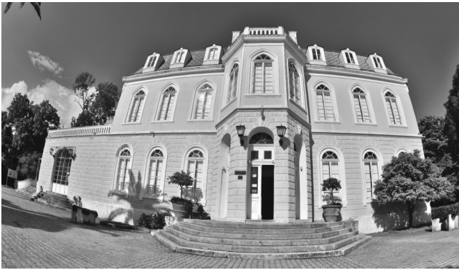
Bar şəhərində Kral Nikolanın sarayı