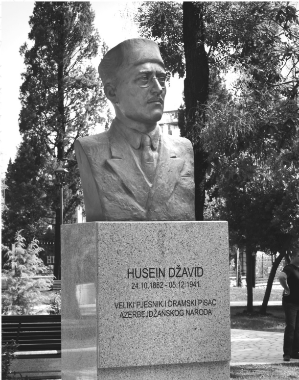
Kral parkında Hüseyn Cavidin büstü