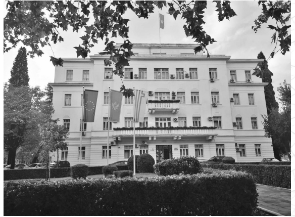
Podqoritsa şəhər bələdiyyəsi