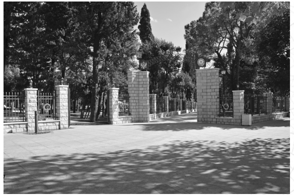
Kral parkının girişi iki ölkənin gerbləri