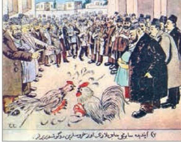
İLL 6. Əzim Əzimzadə “Xoruz döyüşü”

Əzimzadənin adı vurğulandıqdan sonra müxtəlif dövrlərdə məşhur olan karikaturaçı rəssamlarımızın adları təqdim edilmişdir.