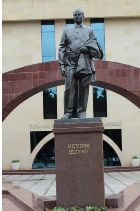
İLL 6. Fuad Salayev “Heydər Əliyevin abidəsi”

metrdir. Fuad Salayevin Ulu Öndərin şərəfinə ucaldığı bütün abidələrdə olduğu kimi bu heykəl də qeyri-adi kompozisiyası ilə fərqlənir. Belə ki, abidənin arxa fonunda yaradılmış qövs günəşin doğmasını, yağışdan sonrakı göyqurşağını ifadə edir. Bu qövs Azərbaycan xalqının, Azərbaycan dövlətinin taleyinə günəş kimi doğan şəxsiyyətə bir işarədir. Eyni zamanda qövs siyasi xarakter daşıyaraq birləşdirici rolunu oynayır, beynəlxalq əməkdaşlığı, xarici əlaqələri simvolizə edir. Obrazın rahat duruşu, pəncəyini çıxararaq əlində tutması onun rahatlığından, sabaha əminliyindən və artıq dövlətin parlaq gələcəyi naminə bütün lazımı məsələləri yoluna qoymasından xəbər verir. Pəncəyin üzərində olan qırıqların xırdalıqla işlənməsi, geyimin diz və dirsək hissəsindəki bükmələr obrazın reallığını daha da artırır. Liderin özünə əmin, eyni zamanda rahat duruşu onun sadə xalqın nümayəndəsi olduğuna və bu xalqın daima yanında olmasının göstəricisidir. Fuad Salayev burada xalqın gələcəyi üçün əlindən gələni əsirgəymədən rəhbər obrazına həyat verib. Doğan günəşin səbəbkarı məhz bu şəxsiyyətdir.