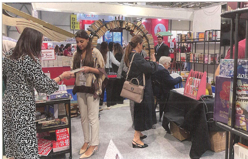
На VIII Бакинской международной книжной выставке-ярмарке

ное, масштабное мероприятие, как Бакинская международная книжная выставка».