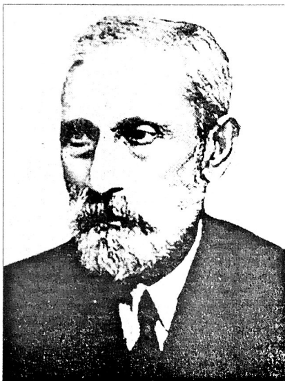
(Окончание. Начало на стр. 8)

Образование АДР – первого на Востоке демократического государства явилось закономерной материализацией всего предыдущего развития общественно-политической мысли, генерируемой в Азербайджане малочисленной, но вобравшей в себя весь теоретический и практический опыт формирования демократических систем и парламентаризма на Западе и в России, прогрессивно мыслящей азербайджанской интеллигенцией, которая «своим интеллектуальным потенциалом, заботой о своем народе, верностью ему служила процессам, происходящим в XX веке в Азербайджане...». Именно они несли на себе священную миссию доведения всего народа до высот цивилизованного раз-