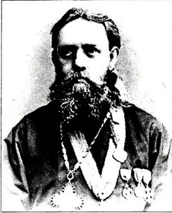
Продолжение. Начало см. в №41, 42, 43

К 80-летию со дня смерти А.И. Юницкого (13.05.1855-25.12.1940)