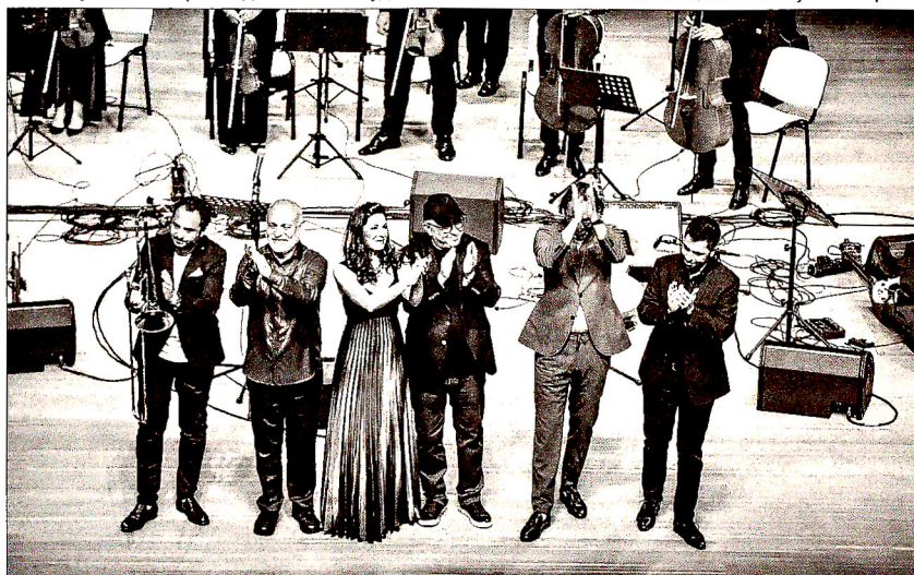
Бакинского камерного оркестра, мы получили огромное удовольствие», – сказала она.

Исполнение музыкантов никого не оставило равнодушным. Слушатели наслаждались потрясающей музыкой и виртуозным мастерством музыкантов. Публика получила огромное удовольствие не только