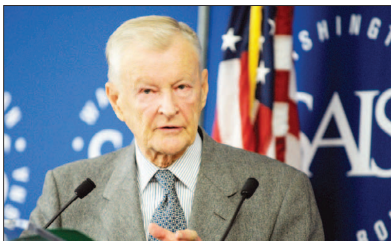
Zbiqnev BJEZİNSKİ, ABŞ Prezidentinin sabiq müşaviri, məşhur politoloq və siyasi xadim

Azərbaycan çox mühüm ölkədir, Siz çox görkəmli lidersiniz. Amerikada bunu getdikcə dərinlən başa düşürəm. Elə buna görə də Azərbaycan – Amerika münasibətlərinin yalnız ikitərəfli deyil, həm də böyük regional, strateji əhəmiyyəti var. Sizinlə söhbətlərimdən çox bəhrələnmişəm. Çünki ABŞ üçün mühüm olan ölkələr haqqında Sizin geniş məlumatınız var.