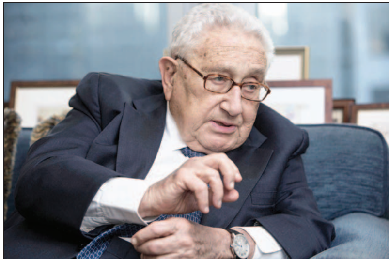
Henri KISSİNCER, ABŞ-in sabiq dövlət katibi, görkəmli ictimai-siyasi xadim

Azərbaycan Prezidentinin Qafqazda atdığı addımları Birləşmiş Ştatlarda diqqətlə izləyirəm. Azərbaycan çox mürəkkəb coğrafi-siyasi məkanda yerləşən dövlətdir. ABŞ və Qərbi ölkələri ilə əlaqələri inkişaf etdirməyi, bazar iqtisadiyyatının və demokratiyanın bərqərar olması üçün əzmlə çalışmağı qarşısına məqsəd qoyan Prezident Heydər Əliyevin fəaliyyəti təqdirəlayiqdir. Heydər Əliyev müstəqilliyi qoruyub saxlamaq uğrunda əzmlə, qətiyyətlə mübarizə aparır.