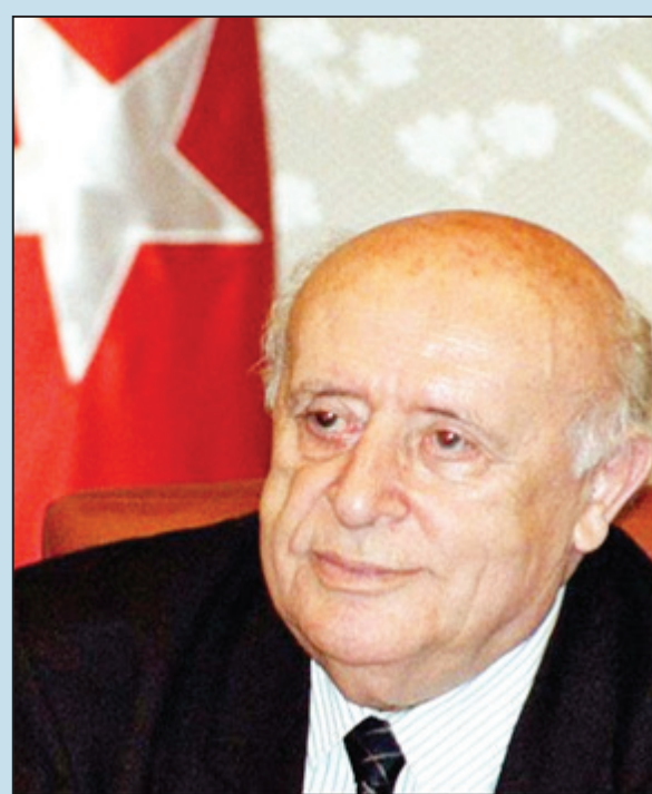
Süleyman DƏMİRƏL, Türkiyə Prezidenti (1993–2000-ci illərdə)

Mən Sizin Azərbaycanı müasir və firavan dövlətə çevirmək yolunda özələdiyiniz çətinliklərin öhdəsindən gəlmək səylərinizi yüksək qiymətləndirirəm. Xahiş edirəm əmin olasınız ki, mənim administrasiyam 907-ci düzəlişin konqresdə ləğvinə nail olmaq üçün çalışmaqda davam edəcək ki, bu, bizə Azərbaycanda demokratiya və bazar iqtisadiyyatı yaradılması səylərində maksimum səylərinizi göstərməyə imkan versin. Bu mənada, Qafqaz regionunda iqtisadi əlaqələrin yenidən qurulması və Azərbaycanda demokratik institutların və təcrübələrin möhkəmləndirilməsi üçün biz Sizinlə işləmək marağında qalırıq.