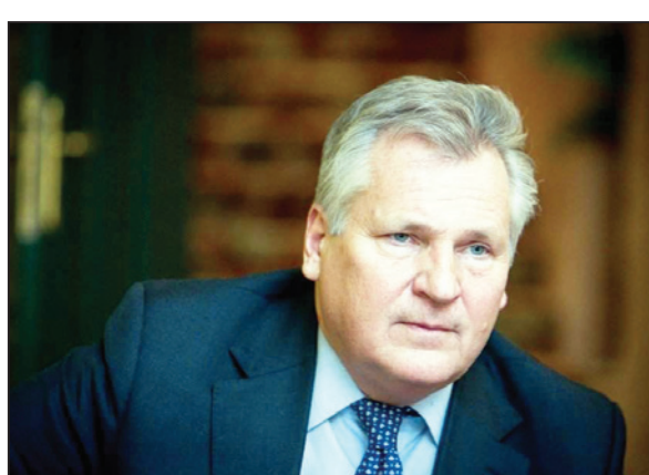
Aleksandr KVASNEVSKİ Polşa Prezidenti (1995–2005-ci illərdə)

Postsovet məkanındakı heç də bütün dövlətlərdə Azərbaycan Prezidenti kimi belə müdrik, təcrübəli adamlar dərhal rəhbərliyə gəlməmişlər. Mənə elə gəlir ki, bu, təsadüfi deyildir. Ona görə təsadüfi deyil ki, bütövlükdə, postsovet məkanında baş verən proseslər nə qədər mürəkkəb olsa da, dövlətlərimizin xalqlarının tələbləri bu münasibətlərdə müsbət nəticə əldə olunmasına yönəldilmişdir. Təbii ki, onlar bu problemləri həll etməyə qadir insanları irəli çəkirlər.