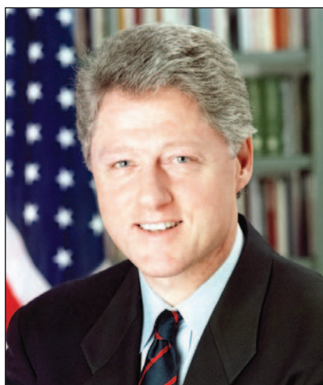
Bill KLİNTON, ABŞ Prezidenti (1993–2001-ci illərdə)

Hörmətli Heydər Əliyevlə ünsiyyət məni həm də bir çox cəhətdən zənginləşdirir. Çünki onun həyat yolu, olduqca böyük siyasi və dövlət fəaliyyəti təcrübəsi mənə də çox şey verir. Bəzən bu və digər problemləri, necə deyərler, sıyrılmış qılıncla həll etmək istəyirsən, müdrik bir insan olan Heydər Əliyev isə tələsməməyi məsləhət görür. Hərçənd dəqiq, sət mövqə ona həmişə xas olan xüsusiyyətdir.