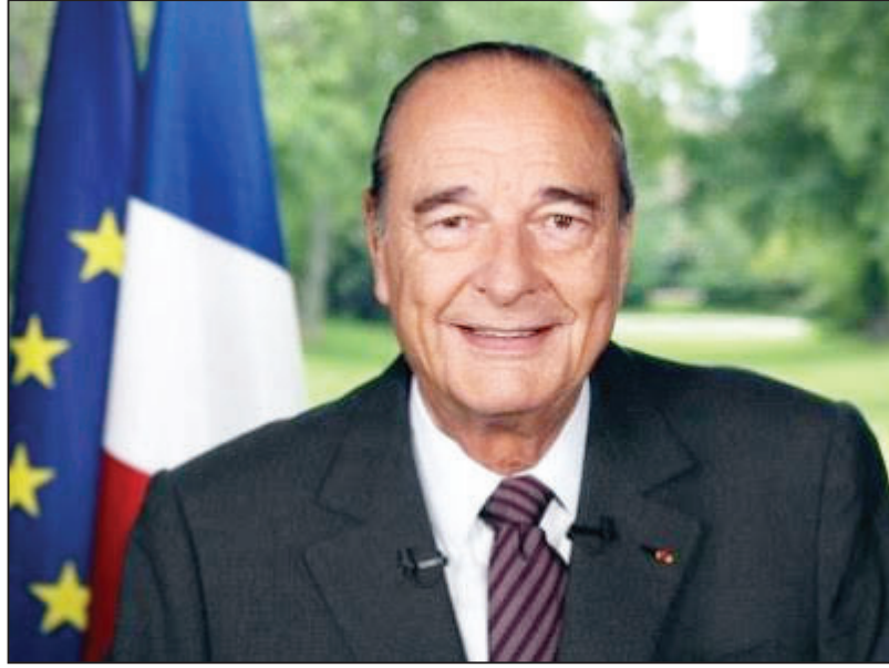
Jak ŞİRAK, Fransa Prezidenti (1995–2007-ci illərdə)

...Prezident Heydər Əliyevi Parisdə qəbul etmək mənim üçün böyük sevincdir. Çoxdandır ki, bizim aramızda qarşılıqlı dostluq münasibətlərindən də artıq əlaqələr yaranmışdır. Mən Prezident Heydər Əliyevə dərin hörmət bəsləyirəm.