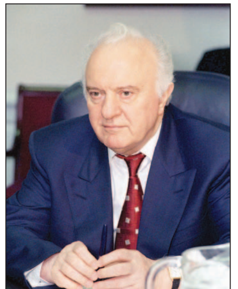
Eduard ŞEVARDNADZE Gürcüstan Prezidenti (1995–2003-cü illərdə)

Heydər Əliyev, mən Sizə həmişə böyük hörmətlə yanaşmışam və yanaşacağam. Çünki bir şəxsiyyət kimi, dövlət xadimi kimi bütün keçmiş Sovet İttifaqı üçün, Azərbaycan xalqı üçün, Yer üzündəki bütün türk xalqları üçün qədir-qiymətini bilirəm.