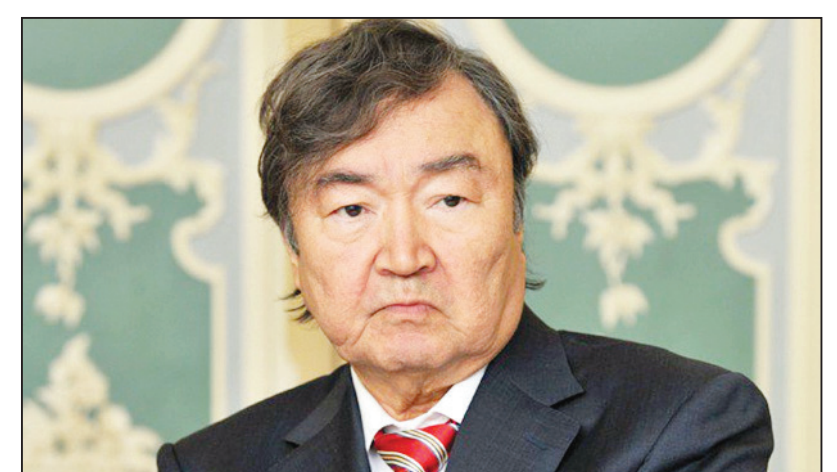
Oļigas SÜLEYMƏNOV, Qazaxıstan yazıçısı, səfir

...Çox vacibdir ki, müstəqilliyin təşəkkül tapdığı məhz bu çətin dövrdə xalqlara Sizin kimi yüksək dərəcəli peşəkarlar, bərkəndəboşdan çıxmış insanlar rəhbərlik etsinlər. Çünki belə imkan xalqlara min ildə bəlkə də bir dəfə verilir və onu əldən buraxmaq olmaz. On dan elə istifadə etmək lazımdır ki, xalq bu dövrdən möhkəmlənmiş halda çıxsın və onun sonrakı nəsilləri irsən müstəqil, sözün əsl mənasında, azad və məşhur insanlar olsunlar. Heydər Əliyev, Sizin kimi rəhbərlərin xidməti məhz bundan ibarətdir.