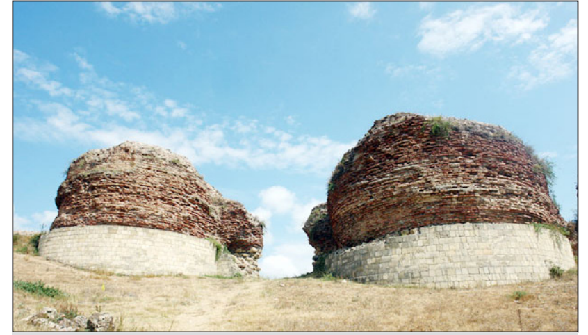
Qəbələnin cənub qala qapısı

Arxeoloji materialların təhlili göstərir ki, V əsrdən sonrakı dövrdə Qəbələnin dünyanın bir çox ölkələri və iri ticarət mərkəzləri ilə mədəni-iqtisadi əlaqələrinin miqyası da nəzərəcarpacaq dərəcədə genişləniüb. Şəhər xarabalıqlarında və onun ətrafında aparılan tədqiqatlar zamanı