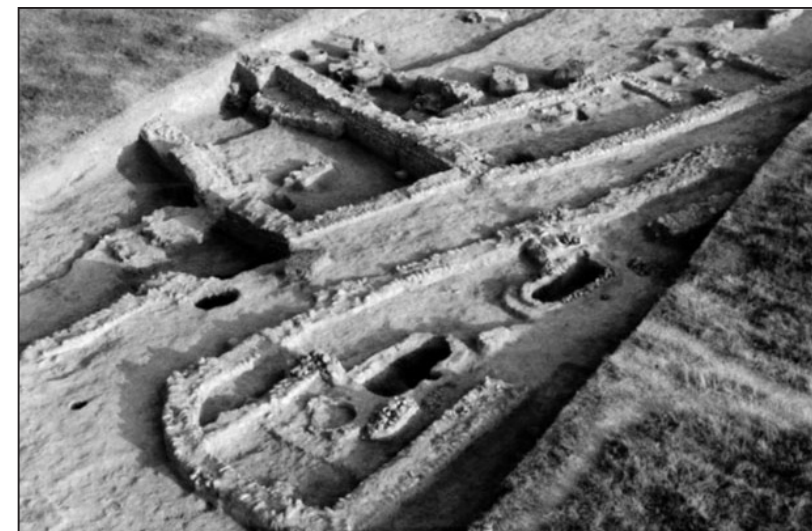
Qəbələdə arxeoloji tədqiqatlardan görüntü

Maraqlıdır ki, tədqiqatlar zamanı Qəbələnin Qala və Səlbir ərazilərində də Antik dövrə aid tapıntılar aşkar olunmuşdur. Məsələn, 1974-1978-ci illərdə Səlbirin cənub-qərb küncündə tədqiqat aparılarkən orada eradan