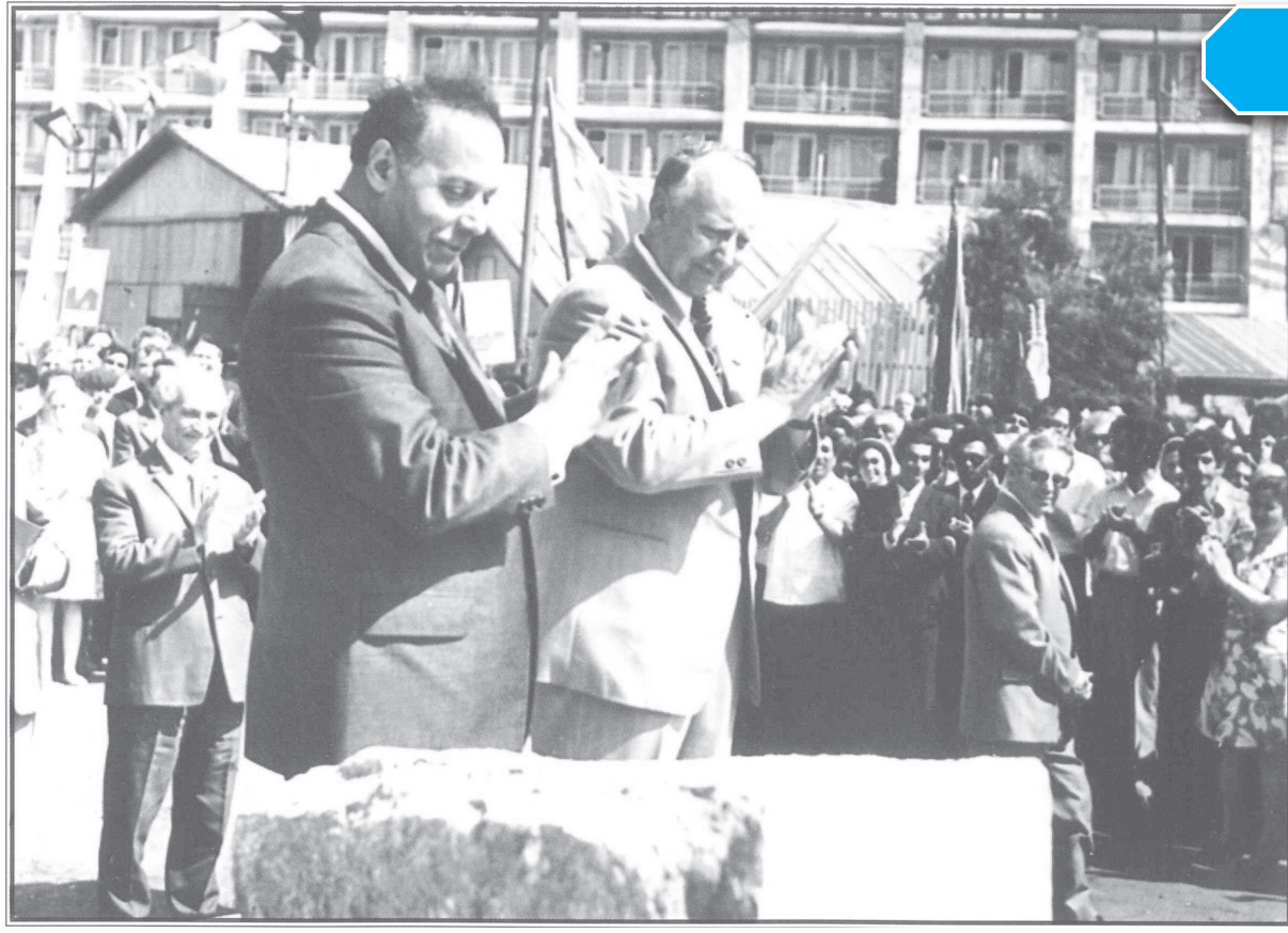
Neft Daşları, 1974-cü il. Heydər Əliyev və SSRİ-nin neft sənayesi naziri Valentin Dmitriyevič Şaşin Neft Daşlarının 25 illiyinə həsr olunmuş təntənəli mərasimdə