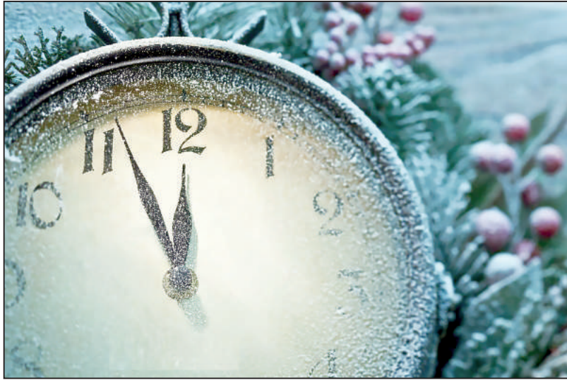
Dünya yeni – 2022-ci ili qarşılayır. Son iki ildə pandemiyanın yaratdığı fəsadlara baxmayaraq, bütün dünyada insanlar bu əziz bayramı böyük coşqu və ümidlərlə qarşılayır. Yeni il Azərbaycan xalqının da əziz bayramlarından biridir.

2020-ci ilin payızında şanlı Qələbə ilə başa çatmış 44 günlük Vətən müharibəsi son illərin, bəlkə də son əsrlərin ən böyük hadisəsi kimi xüsusilə qeyd edilməlidir. Qarabağ torpaqlarının Ermənistanın 30 illik işğalından azad edilməsi Prezident İlham Əliyevin xalqımız qarşısında ən böyük və tarixi xidməti kimi min illər bundan sonra da xatırlanacaq.