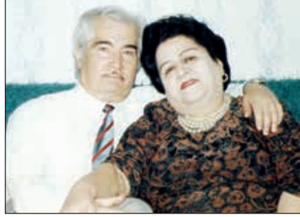
Firudin Səfərov və ən nəhəyat, sonuncu xanımı, SSRİ Xalq artisti Firəngiz Əhmədova ilə

1986-cı ildə Daşkənd teatri “Odlu mələk” tamaşası ilə Moskvaya qastrol səfərinə gedir. Kremlin Qurultaylar Sarayında anlaşıq olur. Hər gün tamaşaya 6 min tamaşaçı baxır. Bu günlər Moskva mətbuatının diqqəti Firudin Səfərov və “Odlu mələk” tamaşasına yönəlir. Əsər