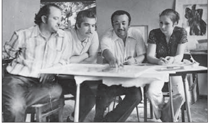
“Koroğlu” operası hazırlanarkən. Ortada operanın rəssamı SSRİ Xalq rəssamı Tahir Salahov