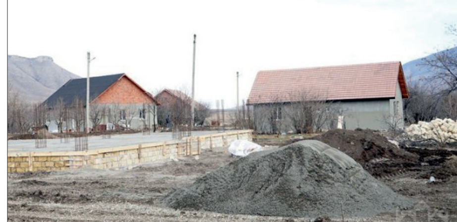
Tahir AYDINOĞLU XQ