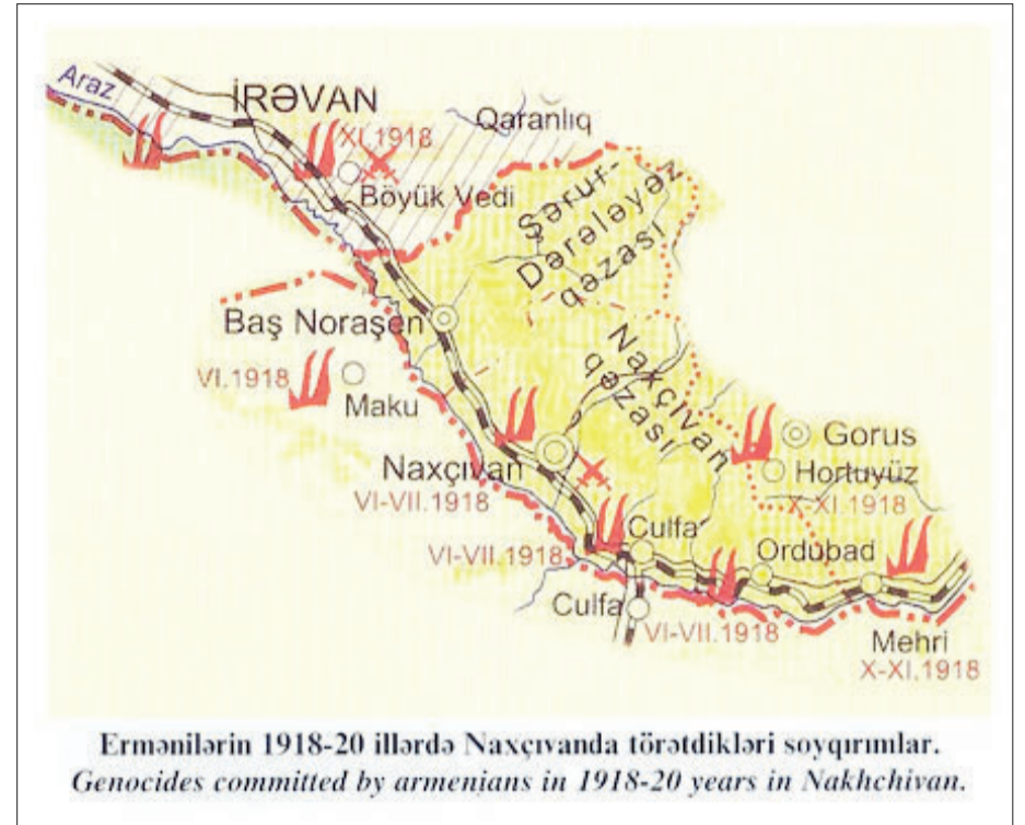
Ermənilərin 1918-20 illərdə Naxçıvanda törətdikləri soyqırımlar. Genocides committed by armenians in 1918-20 years in Nakhchivan.

Ermənilərin bölgədəki fəaliyyətinə son qoyulması ilə nəticələnən əsas hərbi hadisələr iyulun son günlərində baş verdi. Naxçıvan şəhəri ətrafında, Şahtaxtı, Yengicə və Noraşen stansiyalarında hərbi cəhətdən üstün olmalarına baxmayaraq erməni qüvvələri