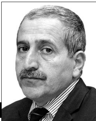
ƏLİ BƏY AZƏRİ