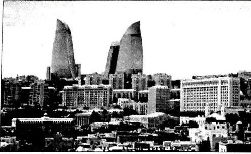
(əvvəli ötən sayımızda)

Öz vətəndaşlıq borcunu layiqincə yerinə yetirən Azərbaycan gəncliyi ölkəmizin ərazi bütövlüyünün təmin olunması uğrunda aparılan milli mübarizədə böyük əzm və qətiyyət nümayiş etdirir