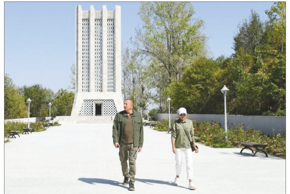
Vaqif məqbərəsi 2021-ci il

məqbərənin qarşısında həmin gün çıxış edən Prezident İlham Əliyev demişdi: “Ulu öndər Heydər Əliyevin təşəbbüsü ilə inşa edilmiş Molla Pənah Vaqifin məqbərəsinin düz 39 il bundan əvvəl - 1982-ci il yanvarın 14-də açılışı olmuşdur. Bu tarixi gün mənim yadımdadır. Çünki o vaxt atamla bərabər, bax, bu yerdə mən də durmuşdum. Bu, tarixi videokadrlar da var. Çox