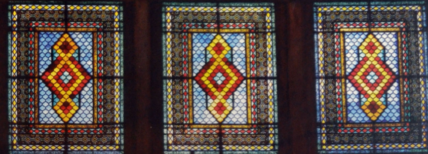
Ковер-шебеке из разноцветных стекол