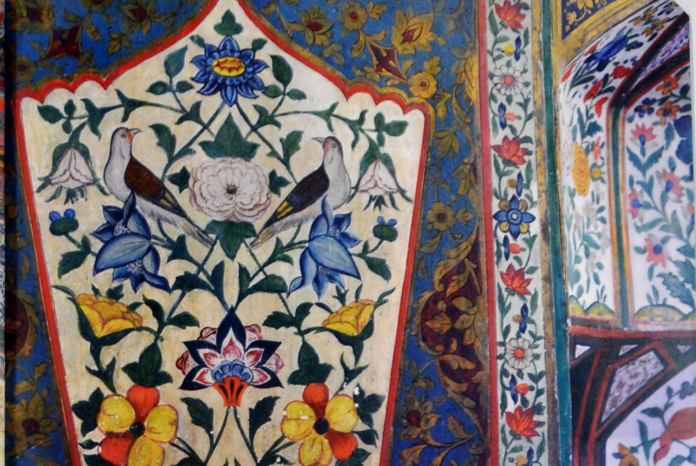
Орнаменты растительного характера с изображением птиц