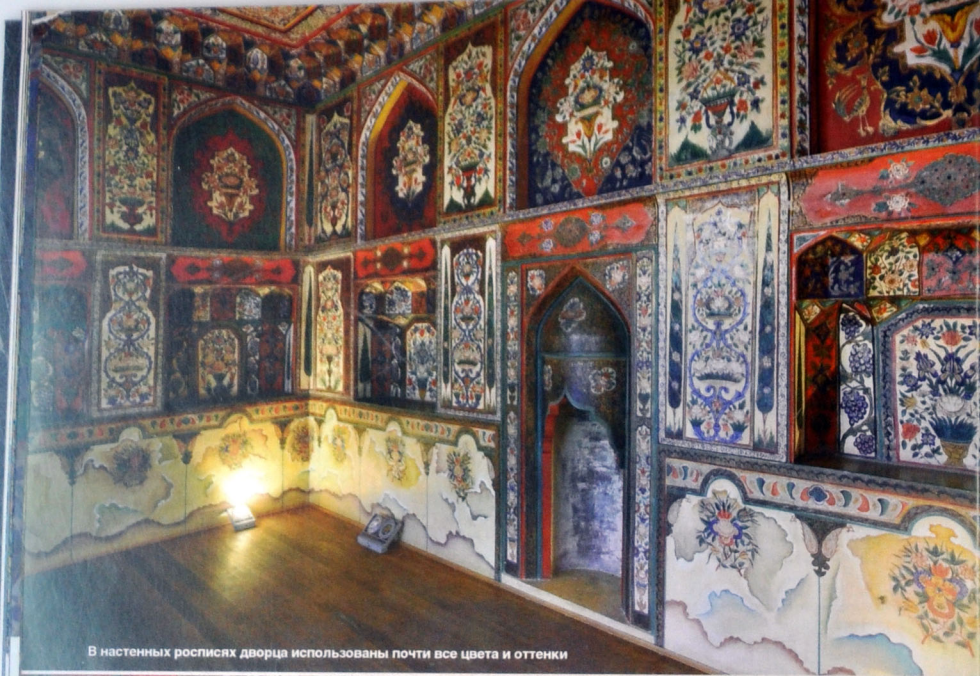
В настенных росписях дворца использованы почти все цвета и оттенки