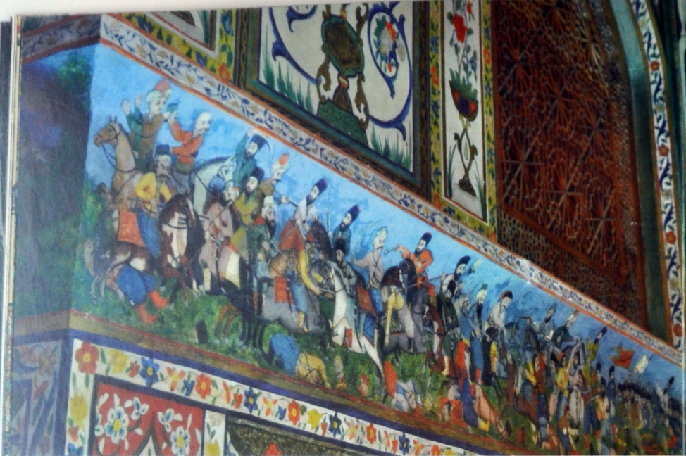
Батальные сцены отражают беспощадные войны, жестокие бои, идущие в регионе

ничных церемоний имеются и в исторических источниках. Из них становится известно, что в 1524 году Сефевидский правитель на территории между Шеки и Грузией организовал большую охоту. В этой церемонии наряду с казиями участвовали и шекинские аристократы.