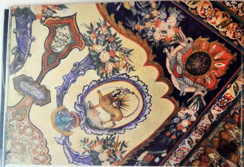
Элемент росписи потолка, на котором изображено мифическое существо, стоящее на рыбе – символ неустойчивости и непостоянства мира и власти.

них поселилась на территории, где находится нынешний город, то есть, на месте селения Нуха, где вновь основала город. Однако интересно, что город вплоть до 1840 года назывался не Нуха, а Шеки. А это указывает на то, что смена названия Шеки в 1840 году не была связана лишь с капризами природы. Утратой своего названия Шеки понес наказание за упорное сопротивление Российской империи. Отметим, что другим городом, который постигла подобная историческая участь, была Гинджа.