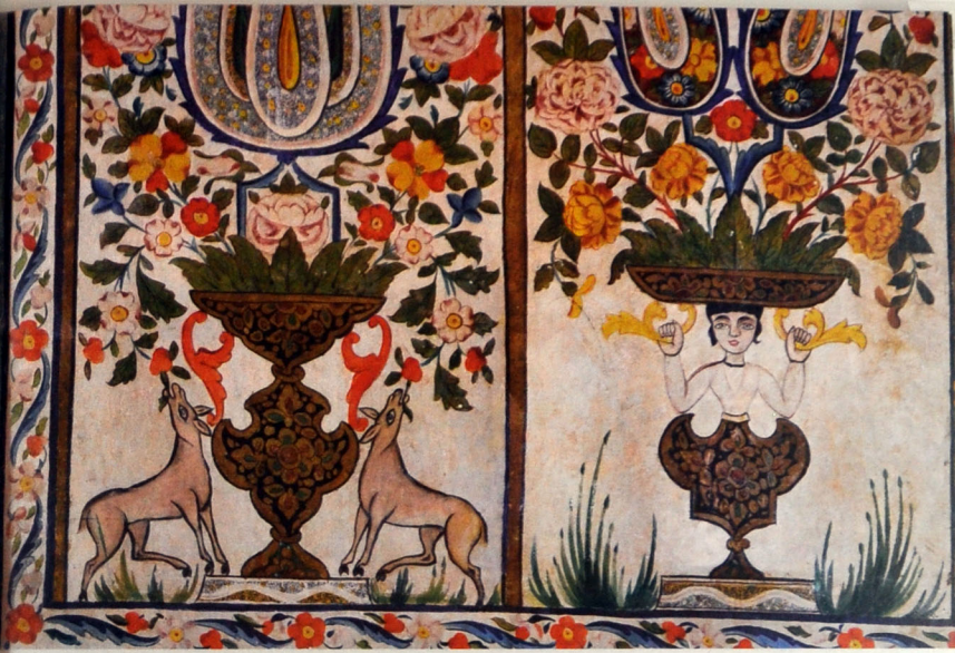
Стены дворца, расписанные орнаментами геометрического и растительного характера, с изображением мифических образов и реальных животных.

Дворец был построен в 1762 году Гусейн ханом, внуком основателя Шекинского ханства Гаджи Челеби в верхней («Юхари баш»), возвышенной части города, в цитадели, окруженной крепостными стенами. Судя по старым планам, он некогда входил в состав комплекса, от которого сейчас сохранились только бассейны и древние деревья. Дворец шекинских ханов являлся летним дворцом. Это двухэтажное здание, обращенное главным фасадом к югу. Надо отметить, что обращенность фасада сооружения к югу является одной из характерных особенностей Шекинской архитектурной школы. Планы этажей повторяют друг друга и сводятся к простому чередованию трех