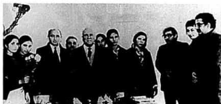
Hüseyn Arif poeziyası işığında