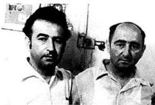
Tofiq Mütəllibov və Hüseyn Arif