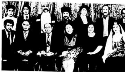
Hüseyn Arif Sumqayıt teatrının aktyorları arasında