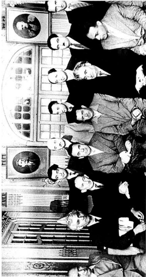
Hüseyn Arif Azərbaycan yazıçı və şairləri arasında