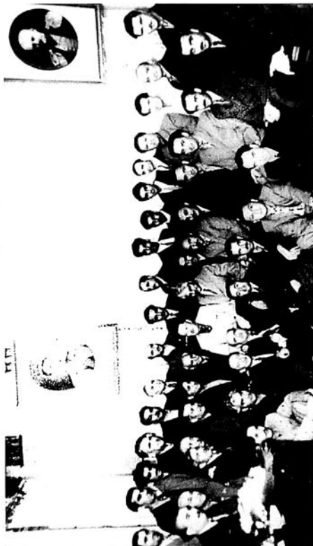
Azərbaycan Yazıqlar İttifaqında