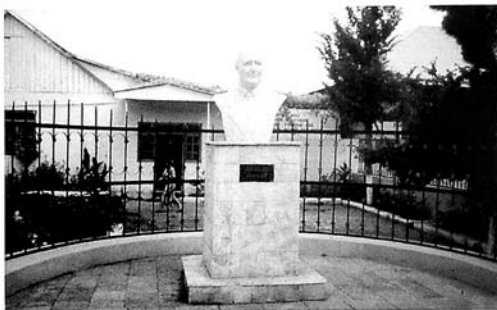
Hüseyn Arif adına Ağstafa musiqi məktəbi

Dilə gəlib ürəyimin fəryadı, Qorunmuş Hüseyn adlı ustadı. Hardan alağ bu ataşi, bu odu, Hər bir ağac belə meyvə bitirməz. Beləsini zaman bir də yetirməz. Hər məclisdə bil, sözünü deyirlər, Yanılmadın yol-izini deyirlər, Qorunmadın sən özünü deyirlər, Qorusaydın, Hüseyn Arif olmazdın Milyonların yaddaşında qalmazdın!