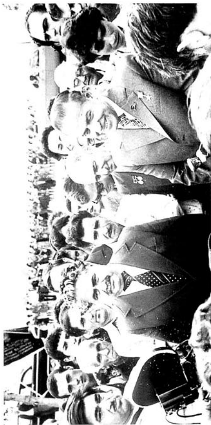
Respublikanın rəhbəri Heydər Əliyev Ağstafa daryoçasının açılış mərasimində, 1971.