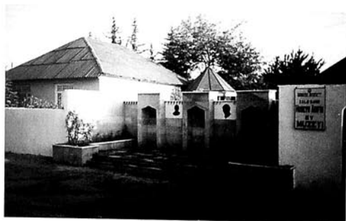
Ağstafa şəhəri. Xalq şairi Hüseyn Arifin ev muzeyinin görünüşü

Xalq şairi Hüseyn Arifin ev muzeyi Ağstafa şəhərində yerləşməklə, Respublika Nazirlər Kabinetinin 24/XII-1992-ci il tarixli 692 sayılı qərarına, Mədəniyyət Nazirliyinin 05/II-1993-cü il tarixli 29 sayılı əmrinə əsasən yaradılmışdır.