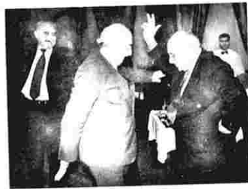
A. Xələfov oğlunun toy məclisində