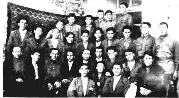
A. Xələfov Tərluca kənd orta məktəbində cüyatken