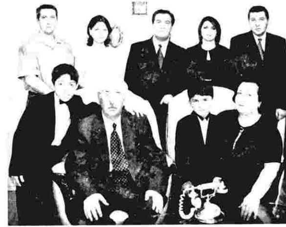
A. Xelefov ailəsi ilə birlikdə