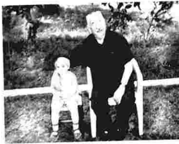
Abuzər baba nəvəsi ilə istirahətdə