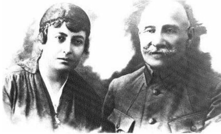
General Əliğa Şixlinski və həyat yoldaşı Nigar xanum Mirzə Hüseyn qızı, 1926-cı il, Baki şəhəri

Onu yalnız tənhalıq sıxırdı. Bu anlarda dünyada ən çox sevdiyi bir adamla səssizcə danışmaq ona təsəlli verirdi. Bu adam şəkil olub divardan asılmışdı. Düz on iki ildən çox idi şəklə dönən insan onun pıçıltılarına cavab vermirdi. Onunla danışanda generalın səsi boş otaqda əks-səda verib özünə qayıdırdı.