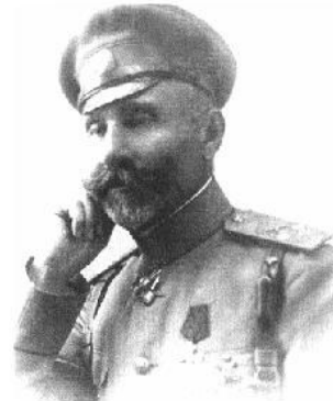
General-mayor Əliğa Hacı İsmayıl ağa oğlu Şıxlinski