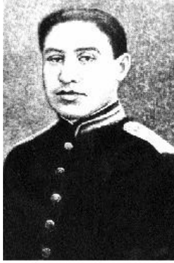
Kursant Əliğa Şıxlinski 1883-cü ildə Tiflisdəki kadet korpusunda təhsil alarkən.

General Əliğa Şıxlinskiyə cavabı: "Hər bir inqilaba əks-inqilab kimi yanaşıram, heç vaxt belə şeylərə qoşulmamışam, qoşulmazdım da..."