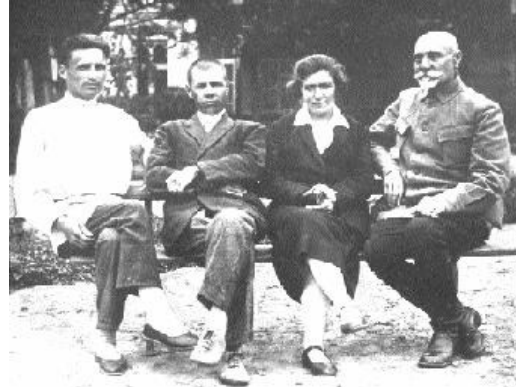
Sağdan birinci General Əliağa Şıxlinski. Şəkil 1942-ci ildə indiki M.Nağıyev xəstəxanasının həyətinə çəkilib.