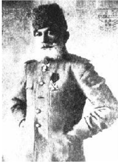
Ə. Şxlinskiin ən yaxın silahdaşı tam artilleriya generalı Səməd bəy Sadıq bəy oğlu Mehmandarov (1855-1931)