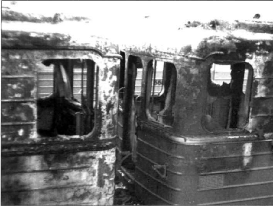
19 mars 1994. Explosion de la rame à la station «20 janvier» du métro de Bakou: 14 morts, 49 blessés.

israéliens aux Jeux Olympiques de Munich en 1972, est de notoriété publique.