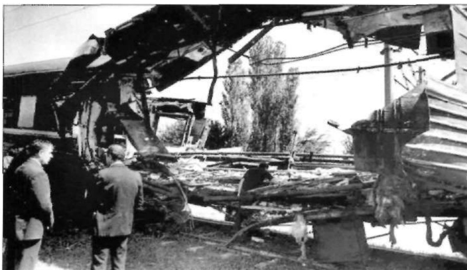
30 mai 1991. A proximité de la gare de Khassavyourt de la République du Daghestan (Fédération de Russie) bombe dans le train de voyageurs Moscou-Bakou. Bilan: 11 morts et 22 blessés.