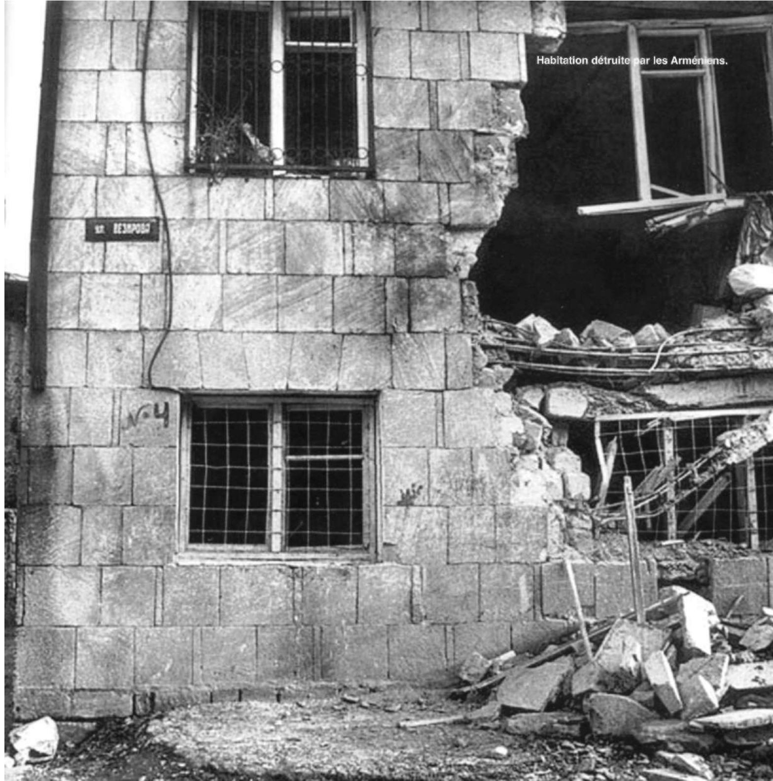
Habitation détruite par les Arméniens.