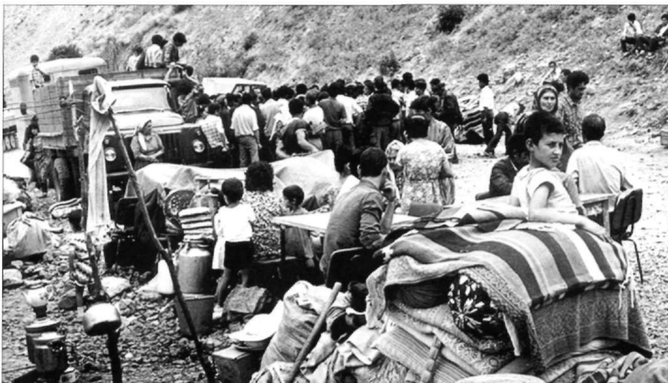
Début de la catastrophe humanitaire.