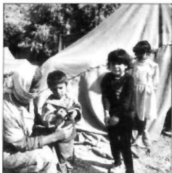
Quel sera le sort de ces enfants?